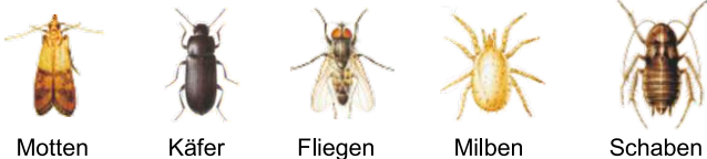
Motten Käfer Fliegen Milben Schaben

Aco.mat DVP wird überwiegend eingesetzt gegen